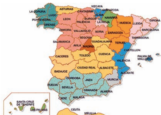
El nuevo Gobierno debe favorecer la cohesión entre CC.AA.

Para todo esto ANPE seguirá manteniendo una actitud, coherente, firme y acorde con su trayectoria sindical : controlaremos los cambios, vigilarémos el proceso y reivindicaremos las mejoras necesarias para el buen funcionamiento del sistema educativo. Y todo, desde el respeto a la Constitución y el leal y decidido apoyo al nuevo equipo ministerial para colaborar, contribuir y hacer posibles las mejoras que el sistema educativo precisa y tanto espera el profesorado.