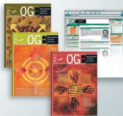
Organización y Gestión Educativa www.oge.net

Envíe este cupón a: C/ Colón, 1 - 5ª planta 46004 Valencia, España