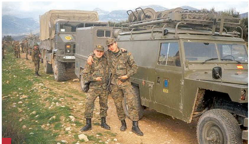
Los funcionarios pueden solicitar que se les reconozca el servicio militar a efectos de jubilación.

En el Sindicato se dispone de modelo de Instancia oficial para que se pueda iniciar el procedimiento para que el organismo correspondiente certifique y reconozca como tiempo a efectos de Clases Pasivas el período de Servicio Militar que superó los 9 meses.