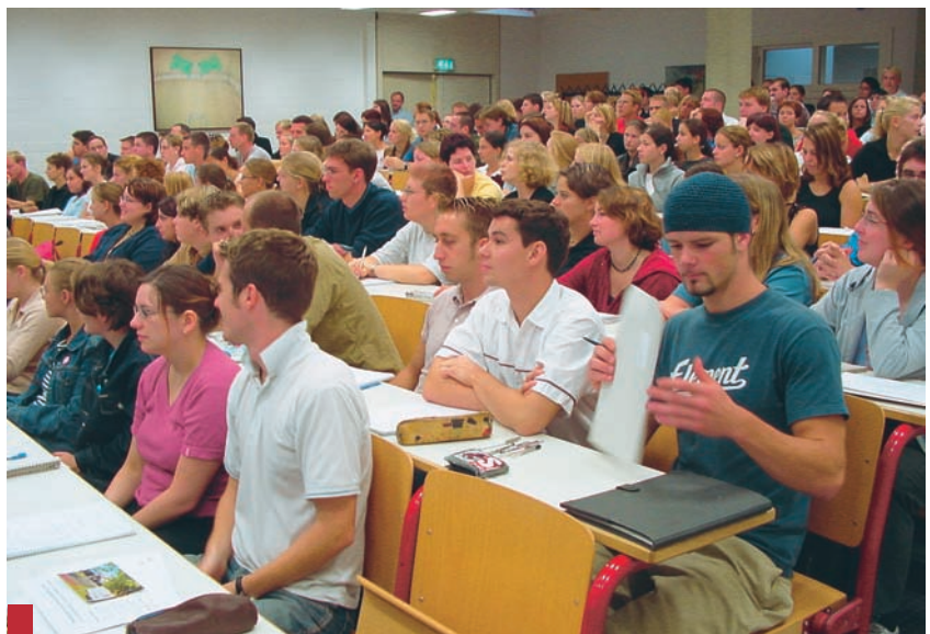
El profesorado funcionario tiene preferencia a la hora de la elección de destinos.

De haber tenido más apoyo esta propuesta, y de haberse llevado a cabo, se hubiera favorecido a un gran colectivo docente por el que ANPE también lucha