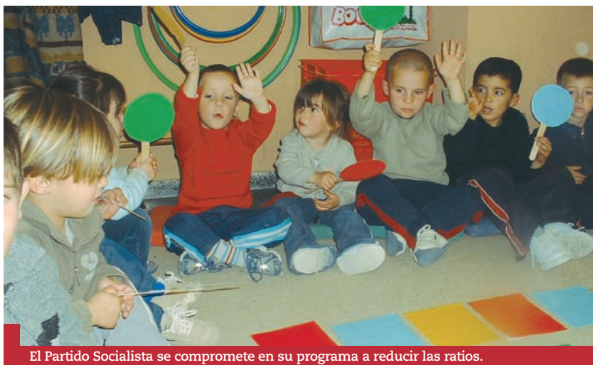
El Partido Socialista se compromete en su programa a reducir los ratios.

para acceder a los ciclos formativos de grado superior o la prueba de acceso a la Universidad.