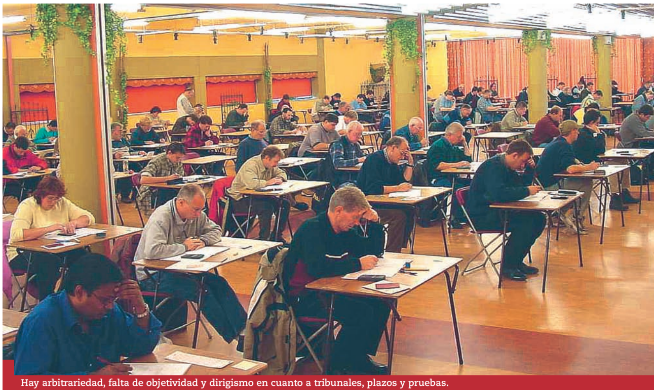
Hay arbitrariedad, falta de objetividad y dirigismo en cuanto a tribunales, plazos y pruebas.