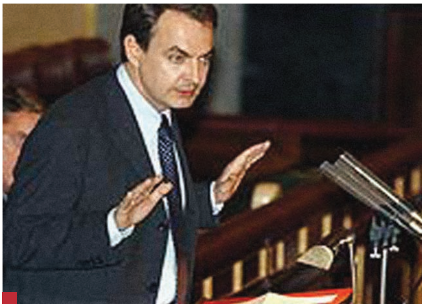
De los 64 minutos del discurso de investidura, Zapatero sólo dedicó 3 a la Educación.

Haciendo un primer análisis matemático, vemos que, Rodríguez Zapatero, empleó 64 minutos (de 11:05hs. a 12:10hs.) en su primer discurso y de ellos, sólo 3 minutos dedicó a la Educación. No voy a ser tan perverso como para sacar el porcentaje del tiempo empleado (4'68%) y pretender que ése sea el