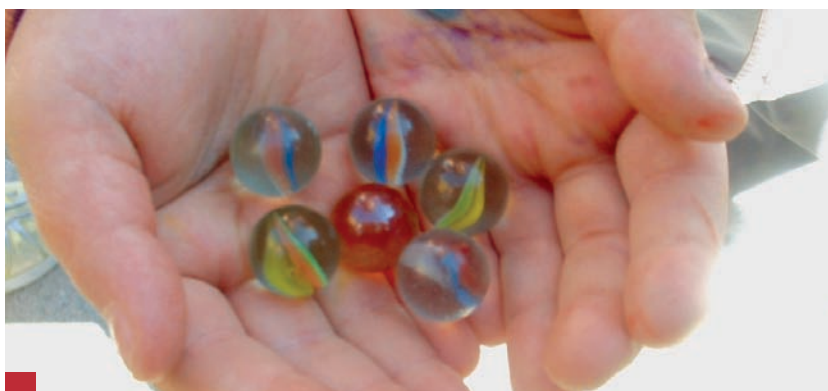
El efecto provoca que autonomías del "furgón de cola", como la nuestra, cada vez sean más pobres.

Y finalizando con la referencia del Evangelio de San Mateo, los administradores que gestionen mejor deberían obtener más talentos del amo (el pueblo) y a los que lo hagan mal, el mismo patrono, en las urnas, les debiera retirar los talentos que les prestó.