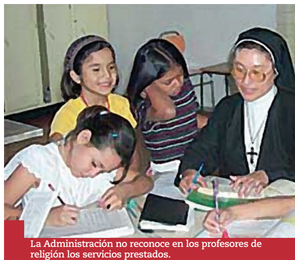
La Administración no reconoce en los profesores de religión los servicios prestados.

momento del reconocimiento del mismo, pero no desde antes, lo que sería un inmenso fraude de ley. En definitiva, en ANPE seguiremos con los procedimientos iniciados al efecto para conseguir que dicho Complemento de la Comunidad Autónoma les sea abonado a este