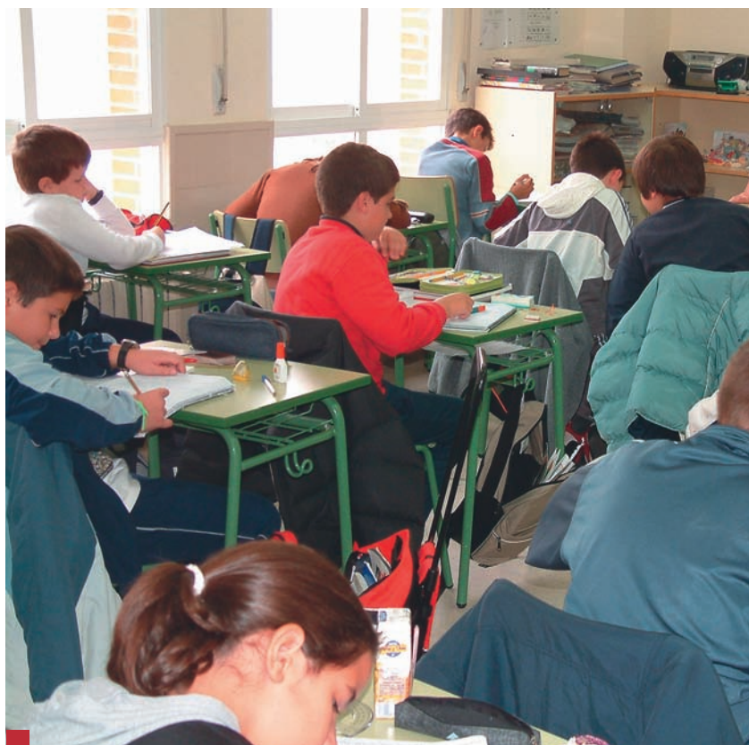
El número de analfabetos en Castilla-La Mancha supera ampliamente la media nacional.

ANPE invita a la Consejería a que Castilla La Mancha vuelva a ser ejemplo educativo para todas las comunidades autónomas de España.