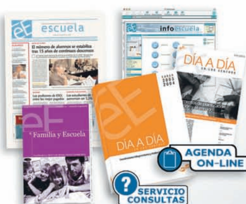
Escuela Española www.infoescuela.com