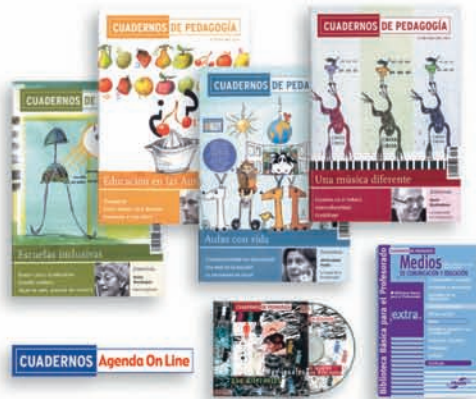
Cuadernos de Pedagogía www.cuadernosdepedagogia.com