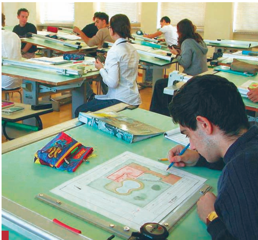
Según la Consejería, seguirá habiendo amplias ofertas de empleo.

Gracias a este acuerdo ANPE pudo negociar directamente la oferta de empleo para Castilla-La Mancha y, así, se convocaron en el año 2000, 801 plazas para Secundaria; en el 2001, 1.501 plazas para los Cuerpos de Maestros, F.P. y EOI.; en el 2002 fueron 892 para Secundaria y Conservatorio; en el 2003 se convocaron 1060 para Maestros; y este año han sido 1275 para Secundaria, FP y Conservatorio. Muchos se quedaron en puertas antes de estas convocatorias, y muchos son los que consiguieron superar el concurso-oposición con la ampliación del número de plazas convocadas.